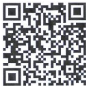
2 e collecte deze zondag t/m zaterdag

Lied: Iedereen zoekt u, oud of jong Lied 837: 1 en 3