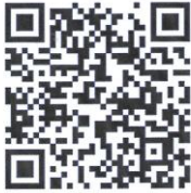
1 e collecte deze zondag t/m zaterdag

Mededelingen en/of toelichting op de inzameling, u kunt uw gift ook overmaken naar rekeningnummer NL 48 RABO 037 37 37 572 t.n.v. Diaconie, onder vermelding van collecte 19 april 206.